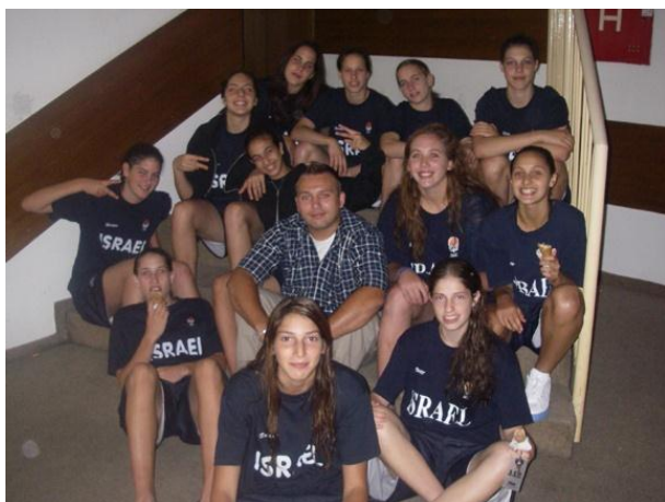
Varovanje športnih delegacij

Storitve varnostnika voznika (naši strokovno usposobljeni varnostniki, s predhodnimi dolgoletnimi delovnimi izkušnjami na področju dela profesionalnih voznikov, poskrbijo, da naročnik varno prispe iz točke A na točko B, ter v kolikor se prevoz opravi z vozilom naročnika, ob postankih poskrbijo, da je vozilo varno pred odtujitvijo, morebitnim poškodovanjem oziroma pred drugimi anomalijami