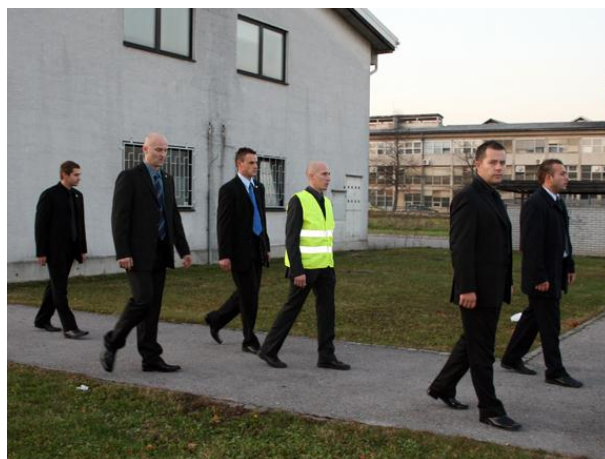
Skupina za varovanje oseb med usposabljanjem

Storitve varnostnika telesnega stražarja (v kolikor ocena ogroženosti izkaže, da je za varnost osebe nujno potreben varnostnik telesni stražar, bodo to delo za vas opravili naši najboljši fantje in dekleta, usposobljeni prav na vseh področjih. Gre za nabor oseb, ki so dolga leta svoje izkušnje nabirali v vrstah policije, vojske, varnostno obveščevalnih službah in podobnih organizacijah.