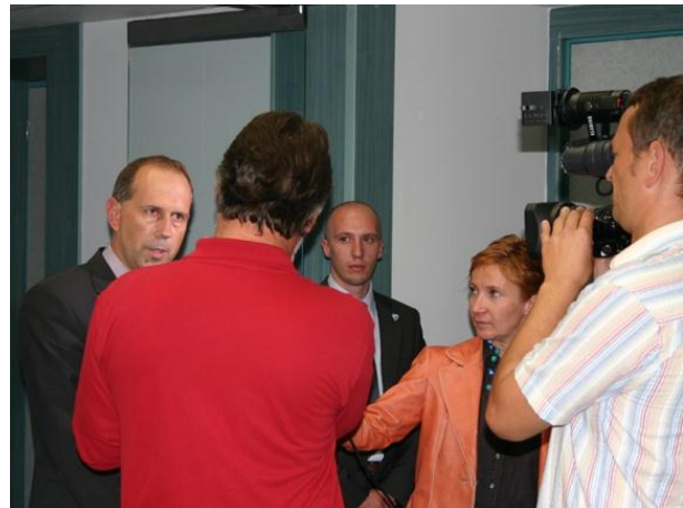
Varovanje poslovnih srečanj

Osnova za načrtovanje in izvedbo varnostnih ukrepov predstavlja ocena tveganja na osnovi katere se določita število in vrsta varnostnih ukrepov ter pripravi načrt za varovanje posamezne prireditve. V načrtu varovanja so podrobno opredeljeni vsi varnostni ukrepi, ki so potrebni za zagotovitev varnosti prireditve oziroma shoda.