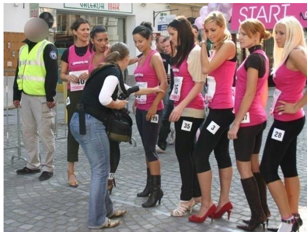
Varovanje javnih zbiranj

Varovanje poslovnih srečanj , z varnostniki telesnimi stražarji in operativci zagotovimo tako fizično kot tudi medijsko varnost vaših poslovnih srečanj. Živimo v času, v katerem običajno poslovno srečanje, praznovanje poslovnega uspeha ali pa čisto zasebno zabavo, okolje s pomočjo medijev, lahko prikaže napačno. "VIP" oziroma medijsko zanimivim osebam, zaradi želje po tovrstnih informacijah, grozijo številni dejavniki, za katere ni nujno, da neposredno ogrožajo varnost take osebe, temveč lahko vplivajo na njihov osebni ugled, ugled podjetja, ki ga le ta vodi, oziroma poslovanju na splošno. Tovrstno nevarnost za VIP osebe, predstavljajo predvsem novinarji, fotografi (mediji - splošno) oziroma posamezniki, pred katerimi je potrebno VIP osebam sprejeti določene varnostne ukrepe zaradi zaščite poslovnih in osebnih interesov, oziroma za zagotovitev poslovnih in osebnih potreb.