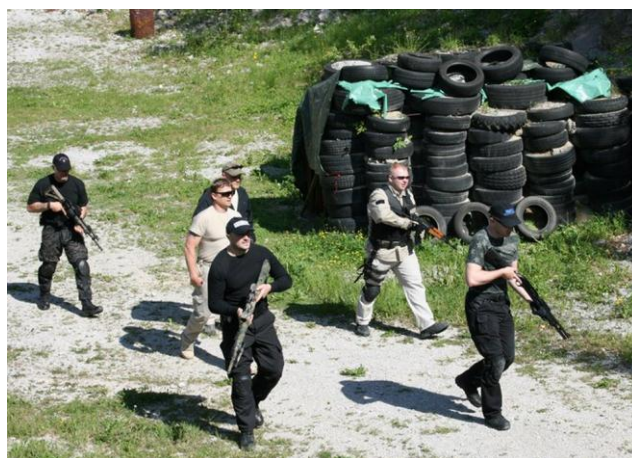
Varovanje na rizičnih območjih