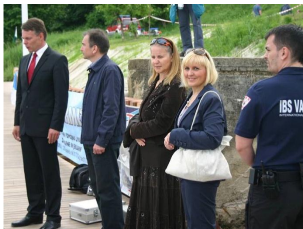
Varovanje slavnostnih dogodkov