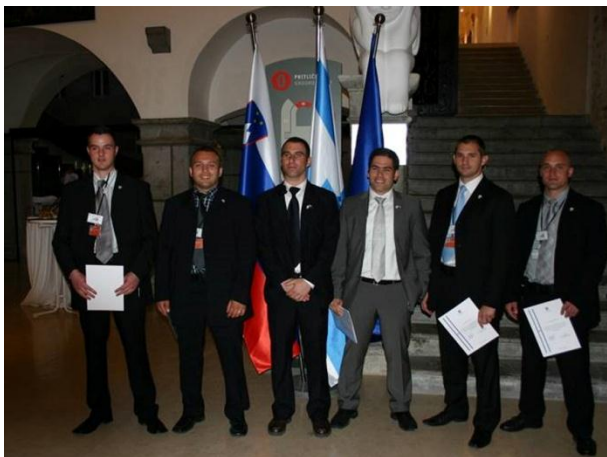
Varovanje eventov, dan neodvisnosti Izraela